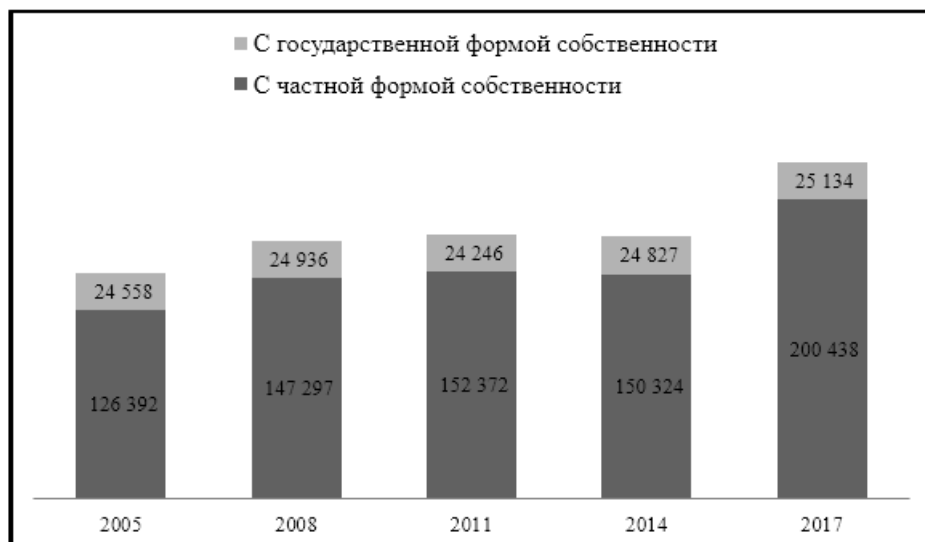
Рисунок 1. Динамика действующих юридических лиц в РК

Север специализируется на сельском хозяйстве, особое значение в котором придается именно зерновому хозяйству. Однако при этом, регион представлен и в животноводстве с преобладанием мясомолочного скотоводства, овцеводства, свиноводства и коневодства. Такая отраслевая направленность способствует развитию частного предпринимательства и не требует масштабного присутствия государственного сектора в экономике региона.