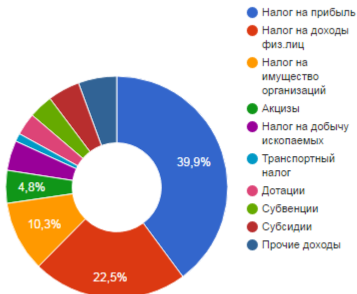
Рис. 1 — Структура доходов бюджета Красноярского края в 2016 г

Основная часть бюджета приходит из налога на прибыль, что составляет 39,9%, также 22,5% — налог на доходы физических лиц и 10,3 % налог на имущество организаций. В сумме эти 3 составляющие формируют 72,7% общего бюджета. Можем в этом убедиться из наглядной диаграммы, изображенной на рис. 1.