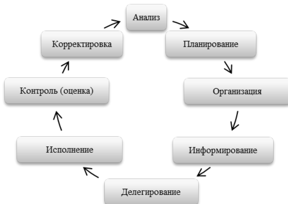
Рисунок 1 — Цикл менеджмента [1, с. 47]

Если рассматривать систему менеджмента организации с позиции этапов осуществления управленческого цикла, то оценка результатов деятельности является одним из звеньев. Поэтому формирование системы оценки деятельности организации является основополагающей задачей, требуемой для решения управленческим аппаратом коммерческого банка.