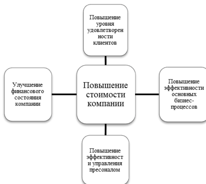
Рисунок 3 — Структура целей организации

В современной практике финансового менеджмента таковым показателем является повышение стоимости компании. Тенденция к повышению стоимости компании является результатом возрастания эффективности работы организации. Это обусловлено тем, что в условиях рыночной экономики именно эффективность определяет жизнеспособность организации.