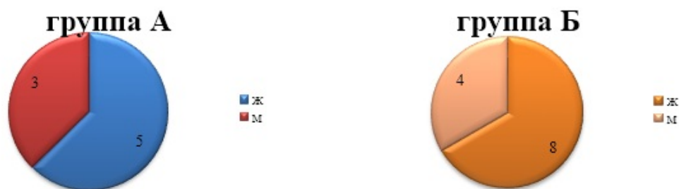
Диаграмма 1. Структура изучаемых групп по полу

Диаграмма 1 отражает структуру изучаемых групп по полу. Результаты показывают, что успешное использование программы не зависит от пола.