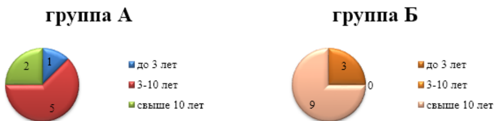
Диаграмма 5. Структура изучаемых групп по опыту работы

Диаграмма 5 отображает, что наиболее способными оказываются сотрудники со стажем работы 3-10 лет.