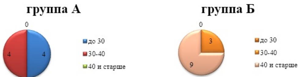
Диаграмма 2. Структура изучаемых групп по возрасту

Согласно диаграмме 2 наиболее успешно справляются с работой в программе лица не старше 40 лет.