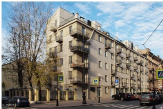
Рис. 1 «Дом-коммуна инженеров и писателей» вид с улицы Рубинштейна.

В начале 1920-х – 1930-х годов в Советском Союзе появилось яркое архитектурное и социальное явление – Дома-коммуны – ставшее воплощением пролетарской идеи «обобществления быта». Причиной создания таких зданий являлась идея «фаланстеров», берущая истоки в учении утопического социализма Шарля Фурье – новая форма жилья, приучающая к коллективизму, освобождающая человека от бытовых обязанностей и постепенного ухода от буржуазного образа жизни. В молодом Советском государстве воплощение идеи коммун начинали с образования общежитий для студентов и рабочей молодёжи, затем для рабочих и потом для деятелей культуры и партий. И в 1929-1931 годах был построен первый в Санкт-Петербурге «Дом-коммуна инженеров и писателей», которому в этом году исполнилось 85 лет.