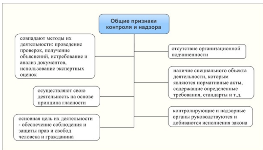
Рис. 1 - Общие признаки контроля и надзора.

Значительная часть признаков, принадлежащих как контролю, так и надзору, совпадают (рис. 1).