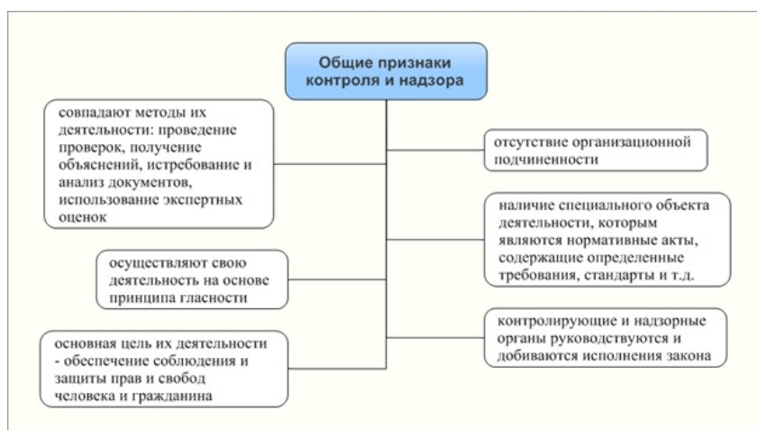
Рис. 1 - Общие признаки контроля и надзора.

Значительная часть признаков, принадлежащих как контролю, так и надзору, совпадают (рис. 1).