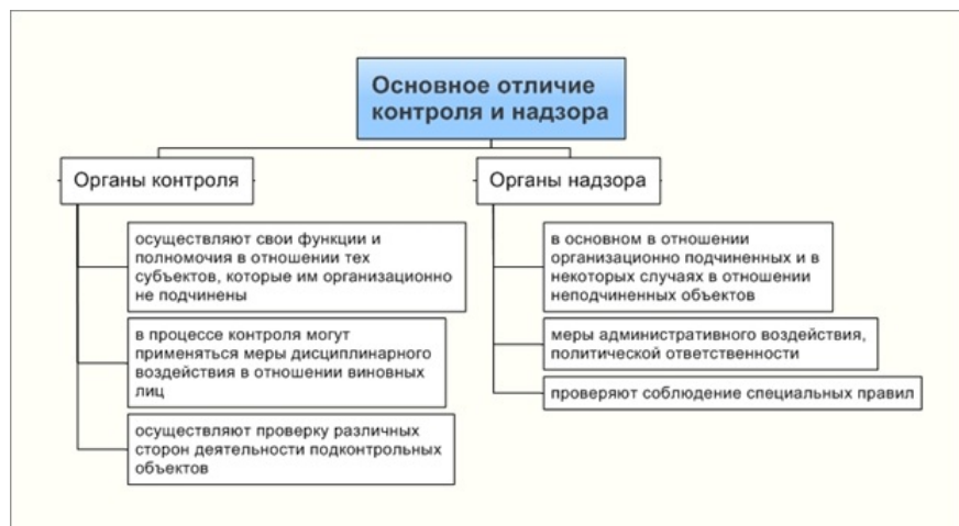
Рис. 2 - Основные отличия контроля от надзора.

Делая вывод относительно сходств и различий контроля и надзора становится понятно, что надзор является более узким в отношении к понятию контроля, обладая, также, своими специфическими признаками. Вместе с тем, органы контроля обладают более широкими возможностями, нежели надзорные.