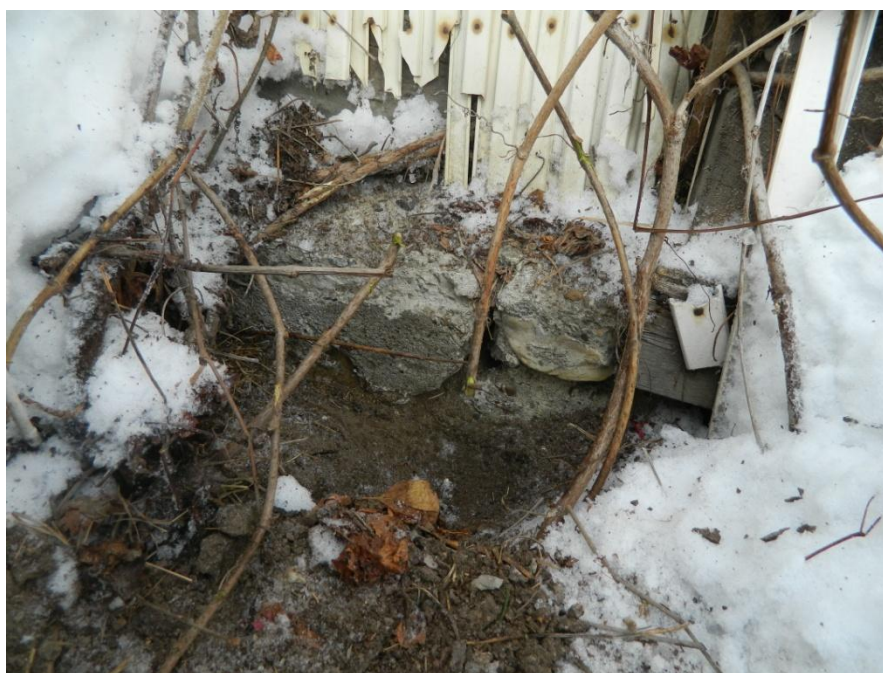
Рис. 2. Пример общего вида дефектов конструкции фундамента.

В соответствии с правилами оценки физического износа жилых зданий ВСН 53-86, анализируя зафиксированные дефекты и повреждения, можно будет сделать следующий вывод: процент физического износа конструкции обследуемого фундамента составляет – 40...45%.