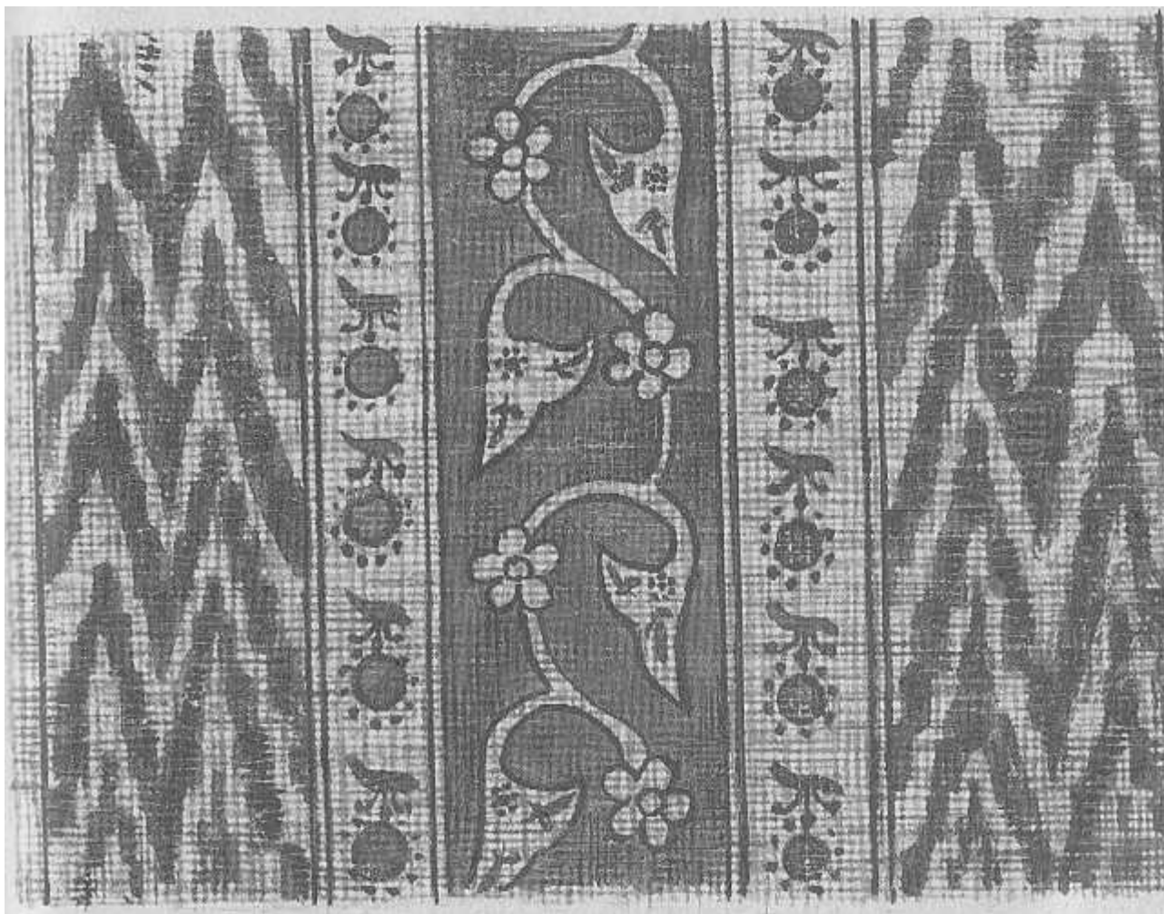
Рис 3. Армянская набойка. XIV в. Матенадаран.

Просуществовало это искусство вплоть до XIX в., Постепенно сокращаться и в виде кустарного промысла сохранилось до первой четверти XX в. Для набоек использовали хлопчатобумажные ткани местного производства, окрашивались они растительными красителями. Красный цвет, например, получали, применяя отвары марены; черный, коричневый и некоторые зеленые — из плодов и листьев молодого грецкого ореха, корки граната и разных трав.