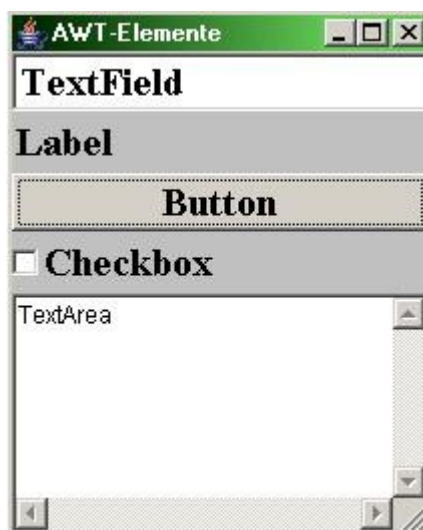
Рис.1 – Образец программы, написанной с использованием AWT в среде Windows

Abstract Window Toolkit (сокращённо AWT) впервые была выпущена в 1995 году компанией Sun Microsystems. Это была первая попытка создать графический интерфейс для Java. AWT выступал в качестве прослойки, вызывающей методы из библиотек, написанных на C. А эти методы, в свою очередь, использовали графические компоненты операционной системы [2]. С одной стороны, программа, построенная таким образом, внешне была похожа на все остальные программы в используемой операционной системе, но с другой, одна и та же программа может выглядеть совершенно по-разному на разных операционных системах, что осложняло разработку. К тому же, ради мультиплатформенности пришлось унифицировать интерфейсы вызовов компонентов, что привело к несколько урезанной функциональности. Набор компонентов также довольно скромный. Например, отсутствуют таблицы, а в кнопки нельзя поместить иконки. AWT старается автоматически освобождать использованные ресурсы. Это влияет на производительность и усложняет архитектуру. AWT прост для освоения, но написание чего-то сложного вызывает затруднения. Сейчас AWT используется в основном для апплетов. Oracle в данный момент поощряет переход разработчиков на Swing, как более безопасный.