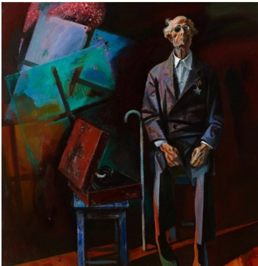
С.Д. Кичко. Майские салюты. 2010.

Определить индивидуальную картину мира Кичко поможет его работа «Майские салюты» (2010). Если описать её формально с помощью искусствоведческих понятий и терминов, то получится следующее: композиция холста вписана в квадрат, это однофигурная открытая композиция, решённая в тёплом колорите, тип колорита тёмный, цветовая композиция — многоцветие. Предметное наполнение холста скудное: два табурета, виниловый проигрыватель и трость старика, особые приметы ветерана — тёмные очки и орден Славы III степени.