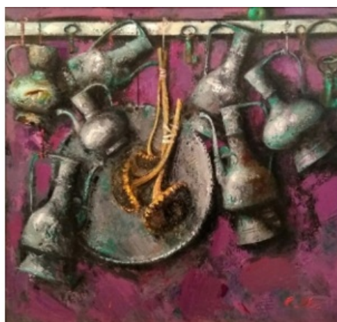
С.Д. Кичко. Натюрморт с лампой. 2017 и Кувшины на стене. 2018.

«В этом типе пластического мышления реализуется желание художника созидать жизнь (он работает с „живым“ красочным слоем), а не просто воспроизводить её. Акцент делается на фактуре, технике мазка, на самом „веществе живописи“ (благодаря чему и усиливается живописность), на самой живописно-пластической массе холста, что объясняется желанием насладиться чувственными энергиями искусства вне его любого идеологического наполнения. Через это раскрывается витальная сила бытия, способность к восприятию не привнесённых извне смыслов, а исключительно из самого художника, наслаждению изобретательностью пластических и цветовых решений, самой текстурой письма. Именно в этом типе пластического мышления „расцветает“ природное начало живописи: живопись становится более живописной» [13; с.266-267].