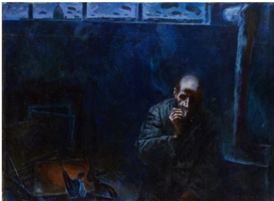
С.Д. Кичко. Блокада. Утро. 1976.

Кичко в ранний период творчества создаёт две (известные нам сегодня) композиции с одной мужской фигурой на холсте: «Блокада. Утро» (1976), «И был вечер...» (1984).