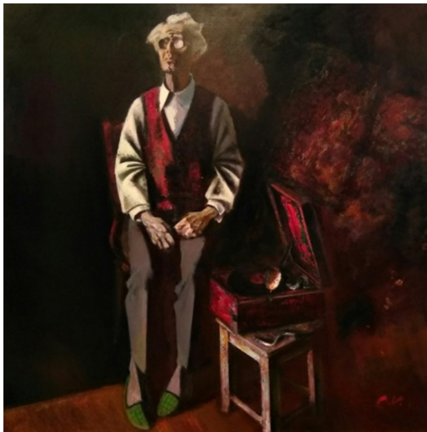
С.Д. Кичко. Рио-Рита. 2016.

в квадрат, являясь однофигурной открытой композицией, решённой в тёплом колорите, тип колорита тёмный, но цветовая композиция — полярная. «Доминантой служит пара контрастирующих цветов, противоположных (полярных) в цветовом круге. Эти цвета могут быть дополнительными, контрастными или близкими к ним, т.е. в большом интервале любого круга. Полярную композицию могут составить только два цвета. У полярной композиции свои «функции и задачи», конкретно в этой работе «для достижения эффекта декоративности, основанного на физиологической потребности глаза в „уравновешивании“ впечатлений. Красота полярных сопоставлений была замечена ещё в глубокой древности. С тех пор контрастные сопоставления возводятся в непреложный закон гармонии и декоративности» [10; с.104]. Предметное наполнение холста ещё более скудное: табурет с виниловым проигрывателем и венский стул, особые приметы старика — очки, жилетка и домашние тапочки.