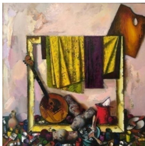
С.Д. Кичко. Натюрморт с грушами. 2014 и Осень. 2014.