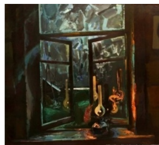
С.Д. Кичко. Ночь на Волге. 1978, Ожидание. 2006 и Ожидание. 2011.

Как и у многих мастеров при создании художественного образа у Сергея Дмитриевича Кичко есть свои предметы-символы, переходящие с полотна на полотно [1; с.58], одним из них является яблоко. Известно, что яблоко, как символ, включает широкий диапазон чувств и состояний, от любви до смерти [1; с.58]. Рассмотрим на примере двух работ этого периода, как искусно художник пользуется и таким средством выразительности не меньше, чем светом и цветом.