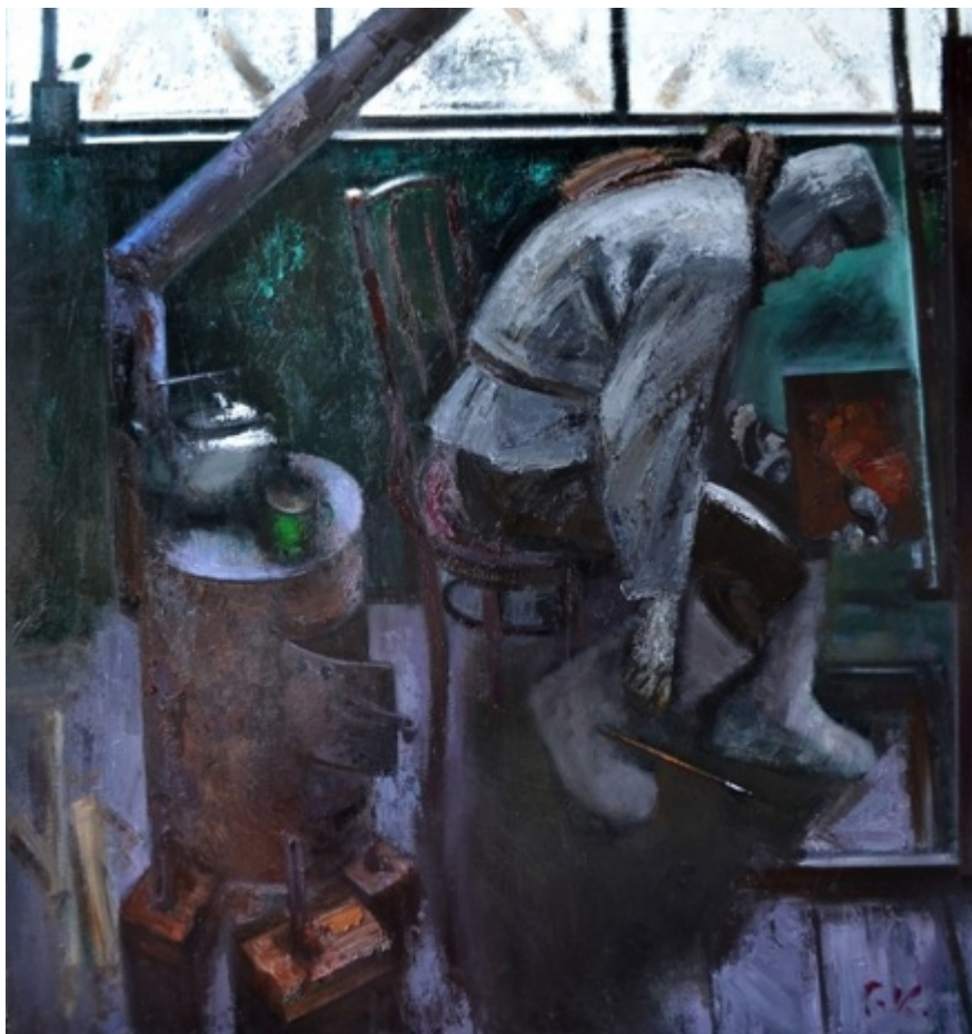
С.Д. Кичко. Зима. Блокада. 2005.

Всё это богатство цвета стало возможным из-за написания холодного, местами чистого белого света, который помогает в определении идеи и эмоций, заложенных автором холста. Благодаря интенсивному цвету в работе «Зима. Блокада» больше всего просматривается пластическое мышление как «декоративность». «Цвет начинает „говорить“ и изображать, а не окрашивать изображенные предметы в характерные для них цвета. Декоративность решала и утверждала существование пространства либо в виде энергии цвета („варварские краски“), либо как энергия краски (мазка, красочной массы). В данном типе пластического мышления художественное пространство могло быть как знаком, так и энергией» [13; с.267-268].