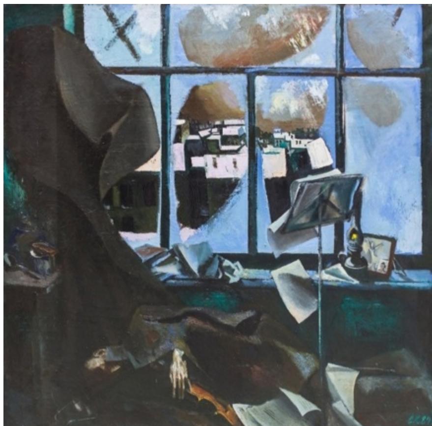
С.Д. Кичко. И был вечер... 1984.