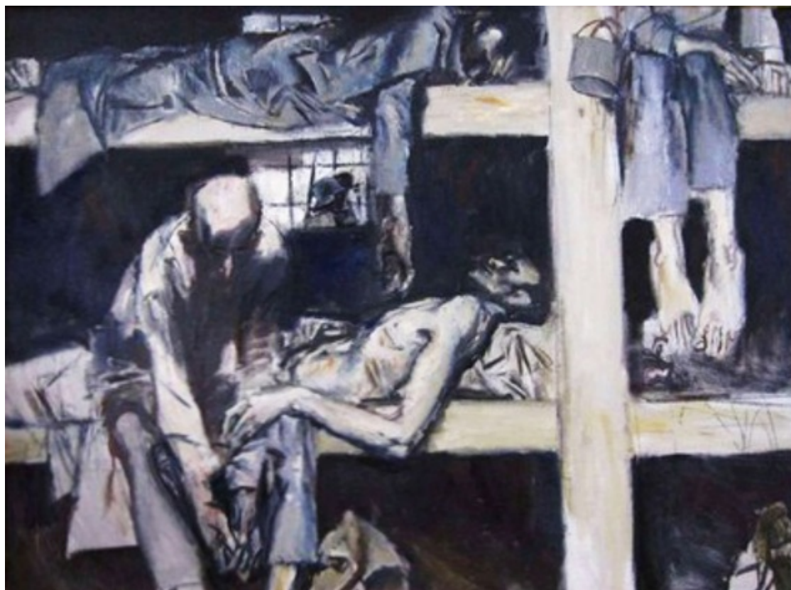
Е.Е. Моисеенко. Барак. 1962.

зелёный — кобальт зелёный светлый и чёрные. В лице мужской фигуры и, особенно, на палитре присутствуют тёплые цвета, которые и уравнивают холодный колорит, не останавливаясь на монохромной цветовой композиции, а доводя её до полярной.