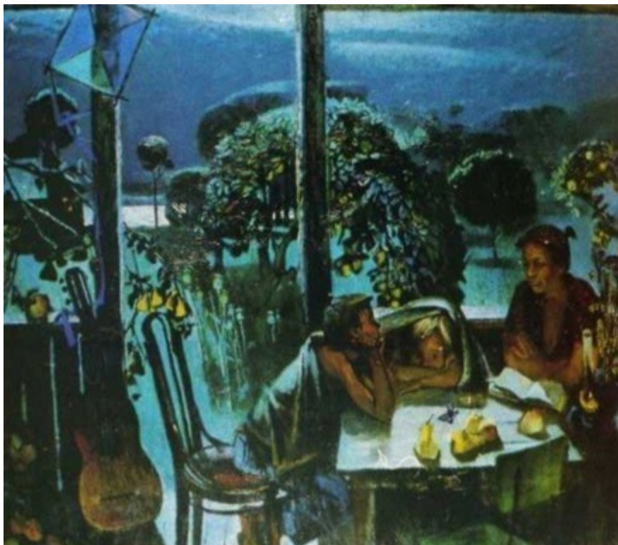
С.Д. Кичко. Серенада лунной ночи. 1989.

Но, забегаая немного вперёд, можно сказать, что две картины Кичко — «Серенада лунной ночи» (1989) и «Е.Е. Моисеенко» (2008) — являются кулисными во втором этапе творчества живописца.