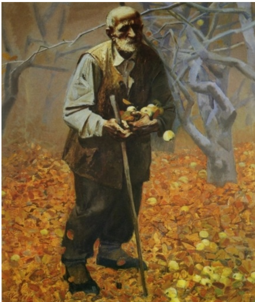
С.Д. Кичко. Последние яблоки. 1995.