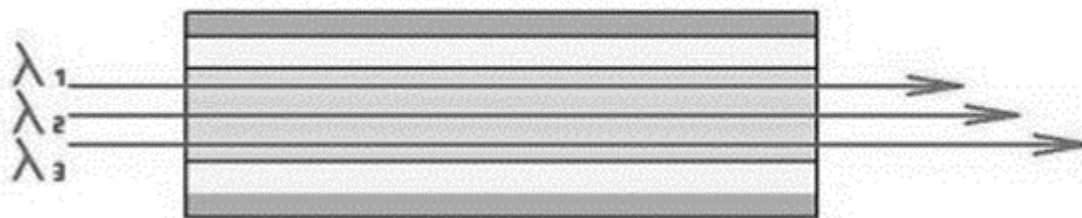
Рис.2. Хроматическая дисперсия вызывается различными длинами волны в источнике света

Хроматическая дисперсия — зависимость групповой скорости распространения моды от длины волны передаваемого сигнала.