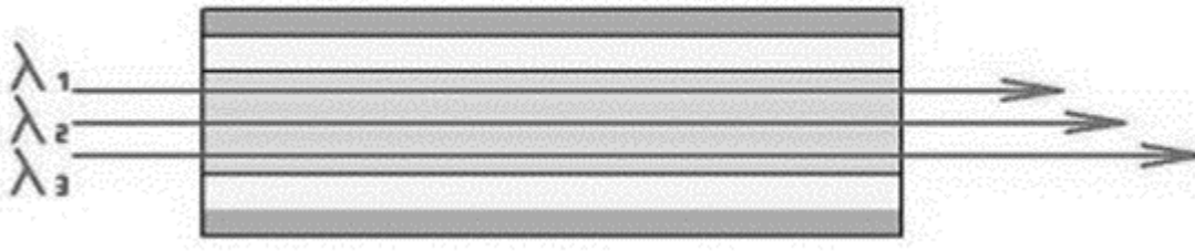
Рис.2. Хроматическая дисперсия вызывается различными длинами волны в источнике света

Хроматическая дисперсия — зависимость групповой скорости распространения моды от длины волны передаваемого сигнала.