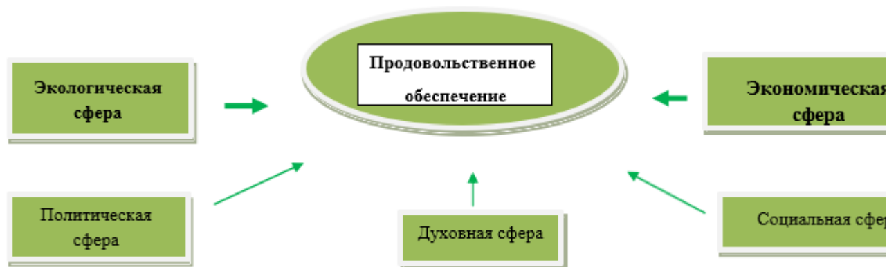
Рис.2. Сферы влияния на продовольственное обеспечение.

Продовольственная безопасность подвержена влиянию со стороны всех общественных сфер, но особое влияние на продовольственное обеспечение населения, на наш взгляд, оказывает экологическая обстановка и текущее состояние экономической безопасности.