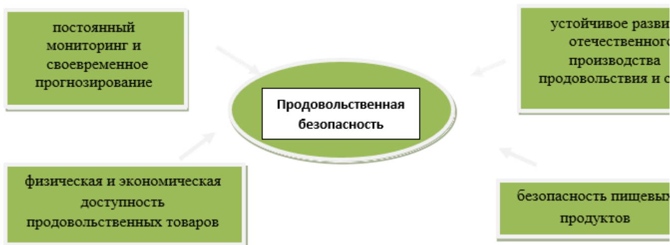
Рис 3. Основные задачи обеспечения продовольственной безопасности

Для создания необходимых стратегических запасов, на наш взгляд, необходимо решать следующие основные задачи обеспечения продовольственной безопасности независимо от изменения внешних и внутренних условий, влияющих на страну (рис. 3):