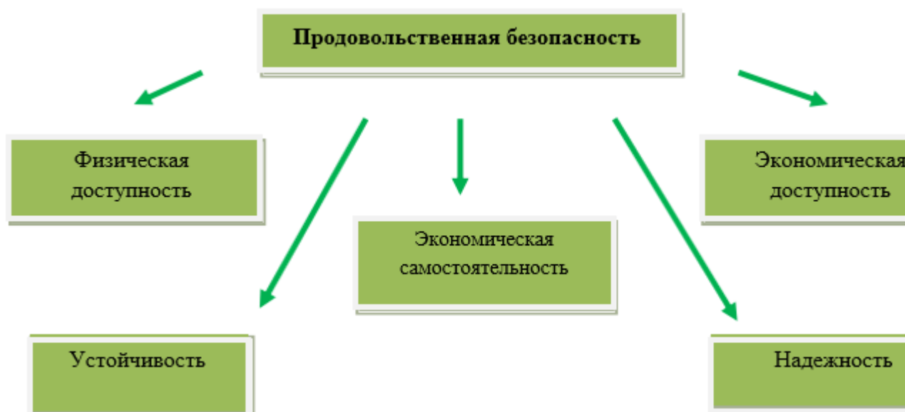
Рис 1.Требования продовольственной безопасности

Из этого определения следует, что продовольственная безопасность страны должна отвечать следующим требованиям: