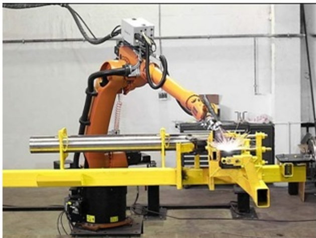
Рисунок 1 — Робот манипулятор выполняет операцию «Сварка»

Те роботы, которые устанавливают заготовки в станок или в приспособление, удаляют отходы из рабочей зоны, контролируют размеры являются вспомогательными.