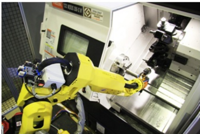
Рисунок 2 — Робот манипулятор устанавливает заготовку в станок

На рисунке 2 представлен робот манипулятор, устанавливающий заготовку в станок.