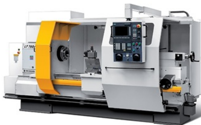
Рисунок 3 — Станок с ЧПУ LT-760

Обработка деталей производится по программе, которая была занесена в ЧПУ ранее. Программа может быть занесена или с помощью внешних носителей, либо же внесена на постоянной основе. На рисунке 3 показан станок с ЧПУ LT-760.