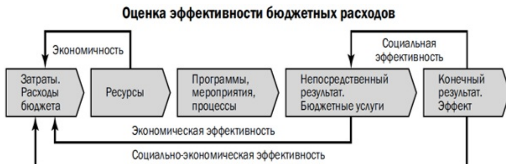
Рис. 1. Виды эффективности бюджетных расходов