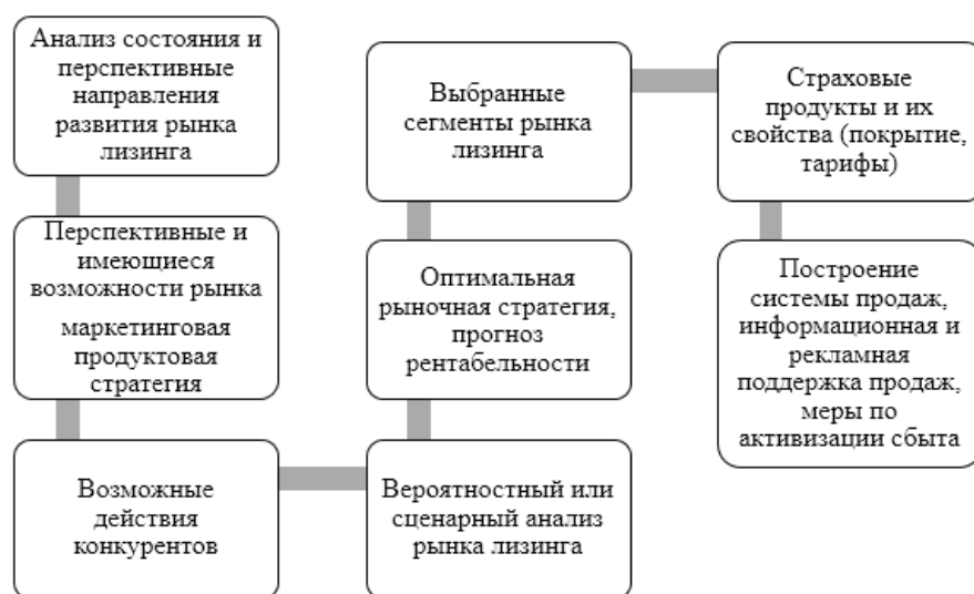
Рисунок 3. Процесс формирования маркетинговой стратегии компании на рынке лизинговых услуг (Составлено автором на основе [3, с. 14])

Все вышеперечисленное позволяет сделать вывод о том, что разработка и реализация правильно выбранной маркетинговой стратегии лизинговых услуг благоприятно отразятся на результатах деятельности компании лизинга и на состоянии развития финансового рынка в целом.