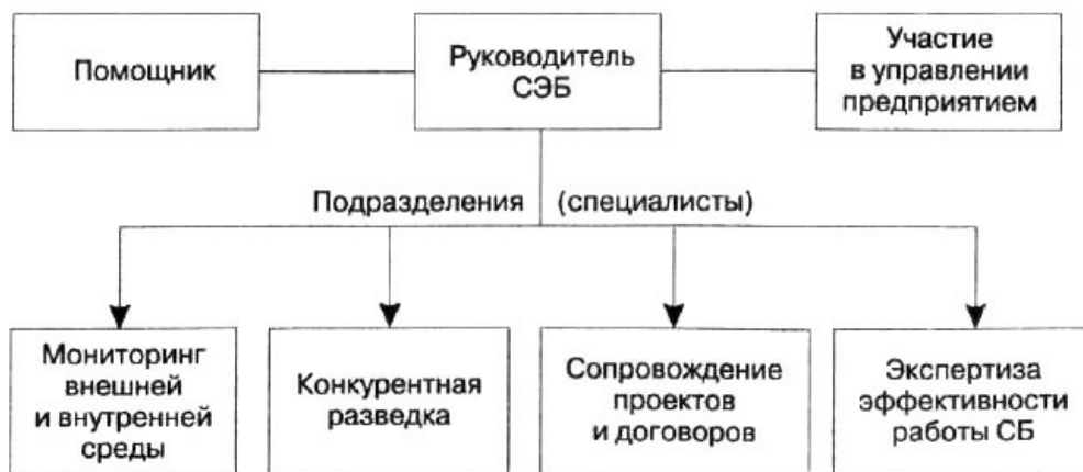
Рис. 13.4. Структура службы экономической безопасности предприятия в условиях конкуренции

Рис.2 Структура службы экономической безопасности предприятия