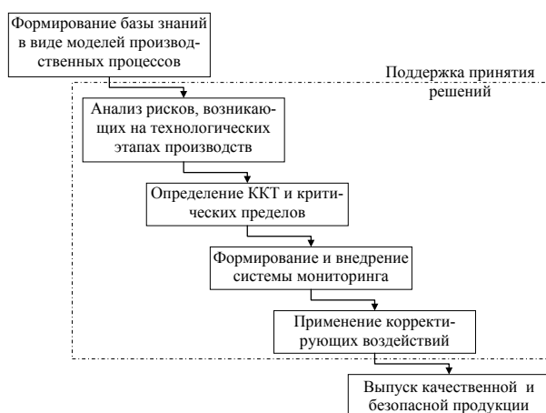
Рис. 1 Функциональная схема «Применение информационно-управляющей системы при производстве пищевых продуктов»

Основываясь на утверждении, что целевая направленность управляющей системы, удовлетворяющей обозначенным требованиям, лежит в плоскости прикладного применения широкого спектра, сформирована функциональная схема, представленная на рисунке 1.